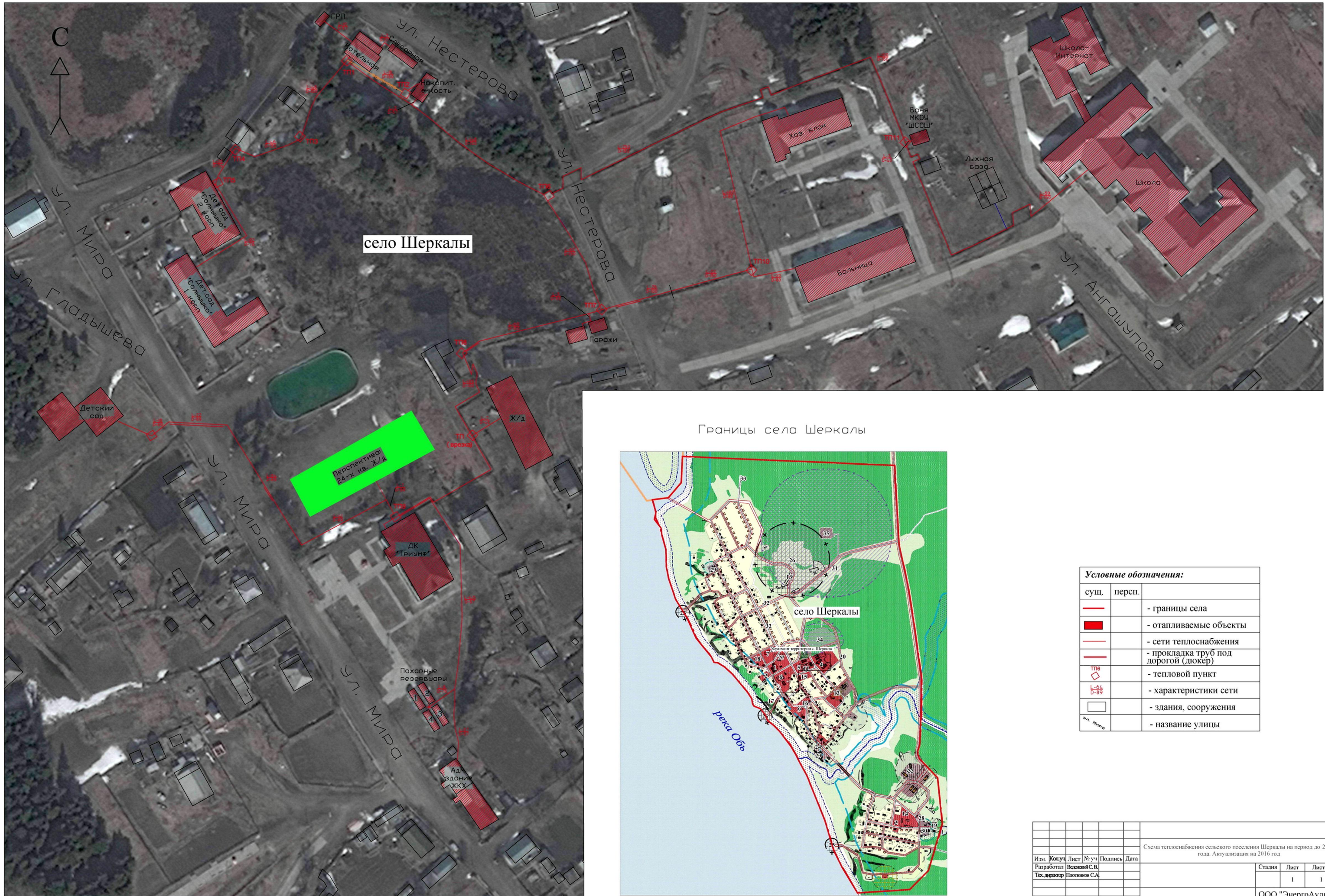
Границы села Шеркалы